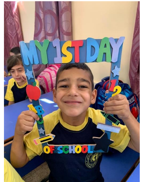
Tänään on kuvan ekaluokkalaisten ensimmäinen päivä Beit Sahourin luterilaisessa koulussa.

Opettajilla loppui kesäloma jo 5. elokuuta, kun he aloittivat suunnittelemaan uutta lukukautta, mutta lapset aloittivat 22. elokuuta. Ensimmäinen koulupäivä oli riemukas, kun monet lapset ja nuoret eivät olleet nähneet toisiaan kesäloman aikana, ja joillekin tämä oli jopa heidän elämänsä ensimmäinen koulupäivä.