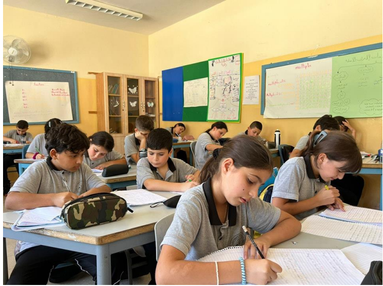
Dar Al-Kaliman koululaiset tekevät työtehtäviään

Luterilaisiin kouluihin ollaan hiljalleen ottamassa käyttöön brittiläistä GCSE-opetussuunnitelmaa. Opetussuunnitelma on paljon vuorovaikutteisempi, ja on tehokas tapa opettaa lapsia ja saada heitä sekä sisäistämään tietoa että ajattelemaan itsenäisesti. Tämä on vaatinut opettajilta paljon työtä ja koulutusta, mutta kuitenkin nähdään, että pitkällä tähtäimellä se tulee tuottamaan tuloksia ja että se sopii mainiosti koulujen kokonaisvaltaiseen opetus- ja kasvatussuunnitelmaan. Dar A-Kalima on ollut ensimmäisenä pilotoimassa opetussuunnitelmaa, joten sitä käytetään jo 1. – 6. luokilla, kun Toivon koulussa ja Beit Sahourissa sitä otetaan tänä vuonna käyttöön.