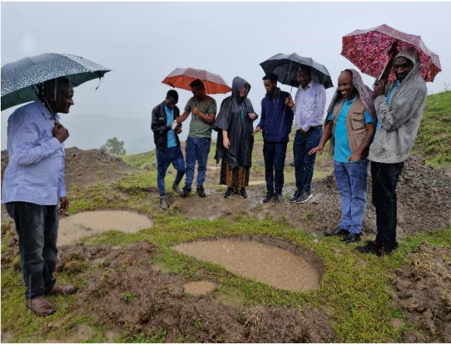
Kuva 2 Valuma-alueen ennallistamistoimia tutkimassa - kaatosateessa!

Tullessamme kylään aurinko paistoi täydeltä taivaalta ja työntekijät kertoivat meille, kuinka nämä erilaiset menetelmät toimivat. Rinteessä oli myös kunnostettu lähde, josta oli tehty kunnan vesipiste alueen asukkaille.