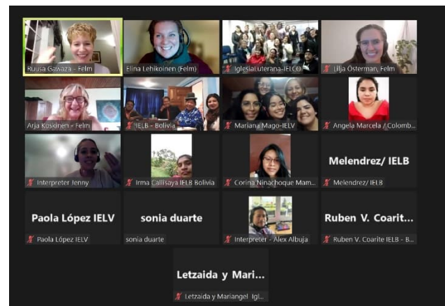
4 Koulutus Zoomin välityksellä latinalaisen Amerikan kumppaniorganisaatioille

Etiopian ohjelma jatkui yhteistyökumppaneidemme työntekijöiden kouluttamisella neljän päivän ajan. Aiheena olivat ilmastokestävyys, ilmastonmuutokseen sopeutuminen sekä sen hillintä ja etäyhteydellä vielä vammaisten ihmisten oikeudet ja inkluusio. Koulutus oli varsinainen taidonnäyte toimivasta hybridi-koulutuksesta, sillä me kouluttajat olimme Etiopiassa, Suomessa ja Kambodzhassa ja osallistujia oli paikan päällä Etiopiassa ja useassa muussa eteläisen Afrikan maassa. Tekniikka toimi hienosti ja koulutus sujui upeasti! Tällaisia koulutuksia olemme järjestäneet nyt useita tämän syksyn aikana kukin meistä Lähetyseuran työntekijöistä aina vuorollaan etäyhteyden päässä ja milloin mitenkään ja joskus tulkkien välityksellä. Koulutukset ovat olleet myös meille eri aihealueiden temaattisille asiantuntijoille todella mielenkiintoisia ja olemme itsekin oppineet, miten eri alojen ammattilaiset kumppaniorganisaatioissamme jakavat keskenään parhaita käytänteitä. Vaikuttavaa työtä ympäri maailman! On ollut myös hienoa huomata, miten paljon yhteistyökumppanimme, esimerkiksi kirkot, haluavat tehdä työtä myös ilmasto-oikeudenmukaisuuden edistämiseksi omissa toimintamaissaan ja yhteisössään. On selvää, että ilmastokriisi on aikamme suurin ongelma ja ne maat ja alueet, jossa Lähetyseura toimii, kärsivät sen seurauksista eniten, vaikka ovat ilmastonmuutoksesta vähiten vastuussa.