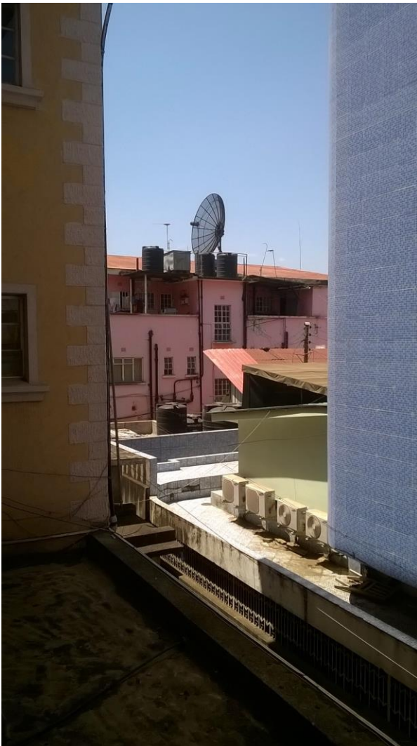
Maisema työhuoneeni ikkunasta Arushassa

Moni on kysynyt, että mitä nämä kaikki päälliköt ja koordinaattorit siellä kentillä oikein tekevät. Nykyisin Lähetysseuran kaikki työ on hankkeistettu. Tämä vaikea sana tarkoittaa yksinkertaisesti sitä, että työ täällä suunnitellaan entistä paremmin ja jokaisen euron käyttö mietitään etukäteen ja raportoidaan jälkikäteen. Suomen lähetysseura on ollut aina luotettava toimija, joka ohjaa rahat sinne missä niitä eniten ja todella tarvitaan. Nykyinen hankejärjestelmä varmistaa tämän ketjun toimivuuden ja läpinäkyvyyden entistä paremmin. Kuitenkin juuri suunnittelu ja raportointi vievät työaikaa. Tätä työtä tekevät sekä kirkollisen työn koordinaattori että vastaava henkilö kehitysyhteistyöpuolella. Lisäksi aluepäällikkö vastaa siitä, että työ todella tulee tehtyä.